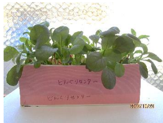
ベビーリーフの種まき